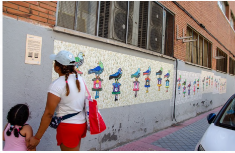
CUCLILLO C/ del Cuclillo, 5