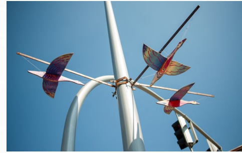
OCA C/ de la Oca, 28-2