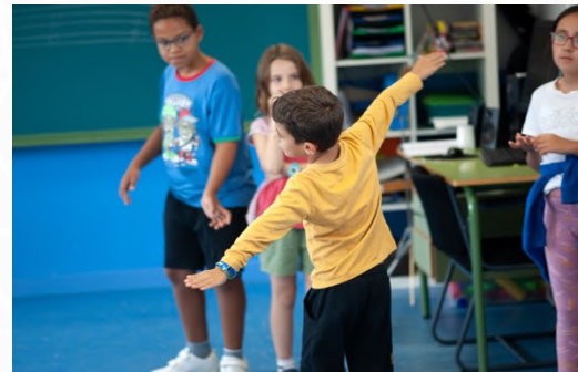
TALLER "LA DANZA DE LOS PÁJAROS" Danza y expresión corporal