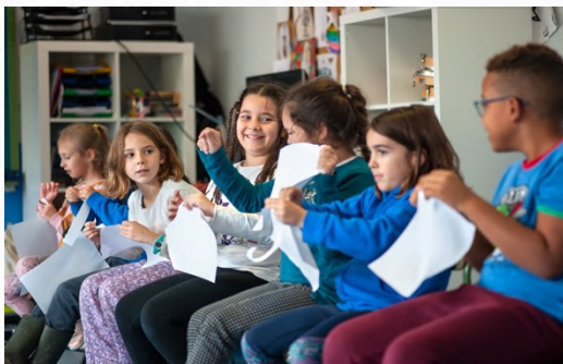
TALLER "SOMOS PÁJAROS" Teatro e improvisación