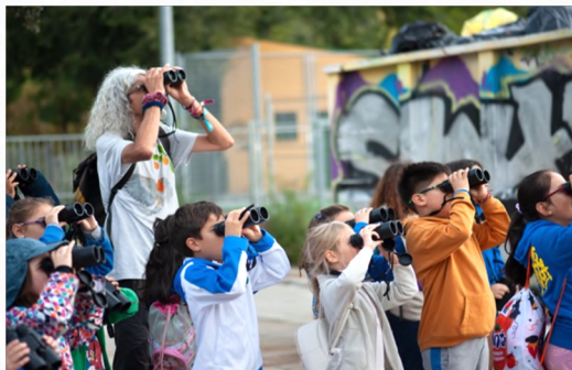
TALLER "A VER AVES" Salidas de campo