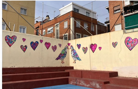
TÓRTOLA C.E.I.P. Lope de Vega