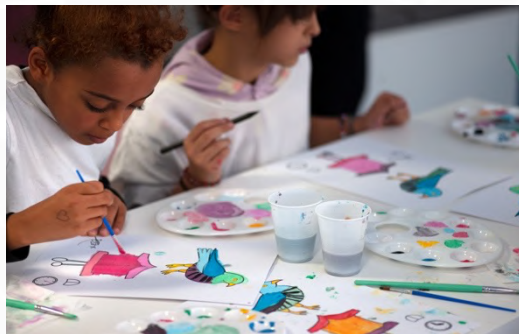
TALLER "PÁJAROS DE PAPEL" Artes plásticas