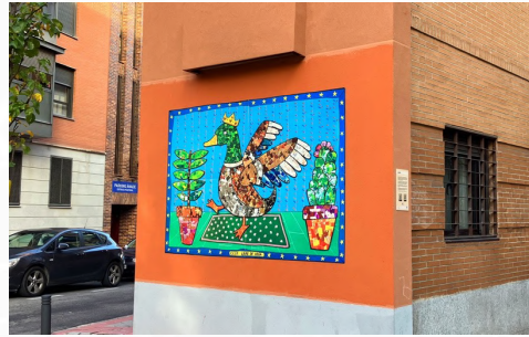
ÁNADE C/ del Ánade, 24