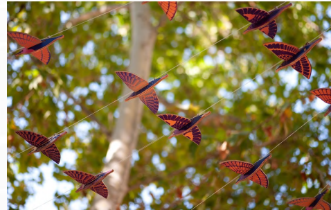
TORDO C/ del Tordo, 9